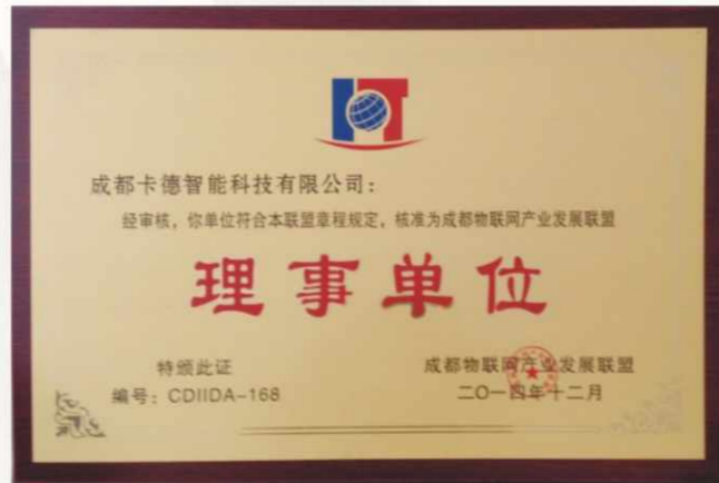
成都物联网产业发展联盟理事单位证书

当预示2015到来的钟声敲响时，心中难免惆怅道“哎，原来我又老了……”，既是凡人终难免俗。