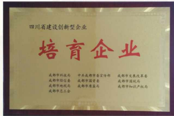
四川省建设创新型企业培育企业证书

四川省建设创新型企业培育企业主要是积极开展技术创新活动，在研发能力建设、创新人才队伍培养、创新机制体制等方面表现突出，技术创新系统不断完善，自主创新能力不断提高，努力走创新发展道路的企业。