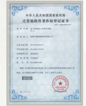
“基于M3核嵌入式软件系统V1.0” 计算机软件著作权登记证书

在2014四川(成都)物联网产业发展年会中，我司“基于云技术的物联网与一卡通融合平台系统”技术，在众多物联网产业企业中脱颖而出，倚靠行业领先和创新度荣获“物联网创新奖”