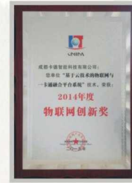
2014年度物联网创新奖

CQC认证证书含金量高，与国际认证同步，其技术要求与国际同等产品认证同步，极大的提高了产品认证证书的含金量。有利于提高获证产品品牌的知名度及竞争力，取得进入市场的绿色通道，提高市场占有率，有助于企业实现经济效益和社会效益的统一。立足符合国家的可持续发展战略，帮助企业得到良性的长远发展。